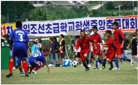
8月 각종체육대회 (고학년)