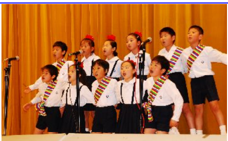
2月 구연발표모임 (저학년)