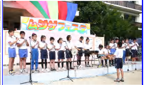
10月 무지개휘스타 (바자)