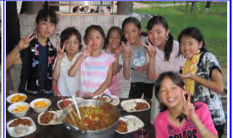
7月 야영 (고학년)