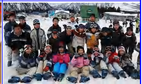
1月 수학여행 (6학년)