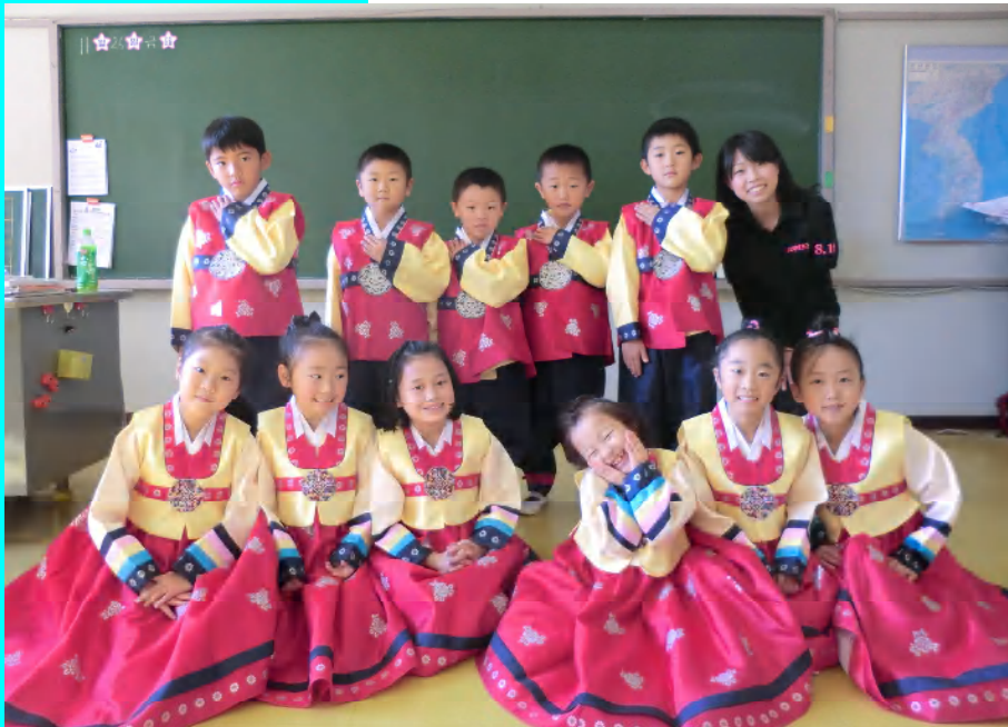
<2010 학년도 초급부 1 학년생>